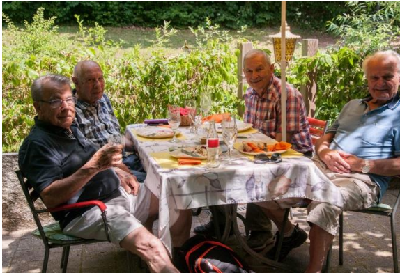
Die Erholung nach der Anstrengung : Schattige Terrasse, kühles Getränk und etwas zum Schmausen