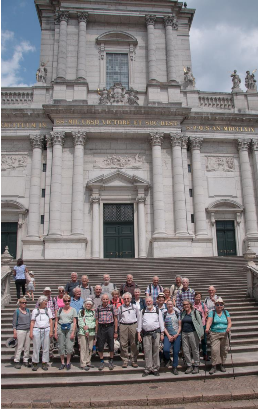
Solothurn : Auf den Stufen der Kathedrale.