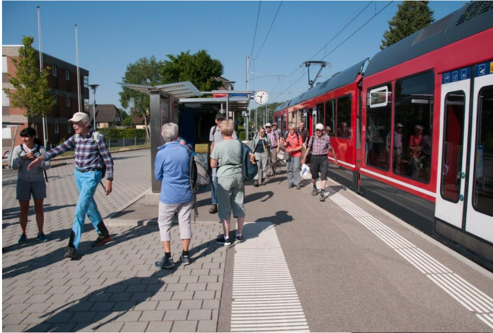
Am Bahnhof Flumenthal treffen sich die zwei Wandergruppen aus Basel und Marly

Hum ... sind alle angemeldeten Teilnehmer da?