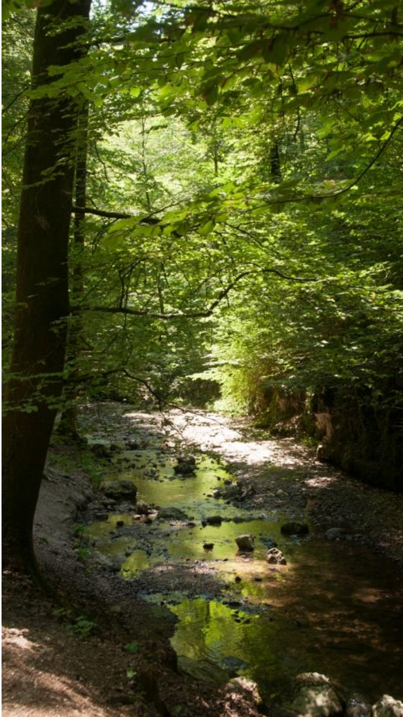
Hier geht es in die Kühlung spendende Verenaschlucht