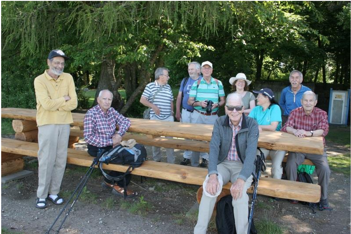
Pause oben auf dem Rücken des Mont Vully.