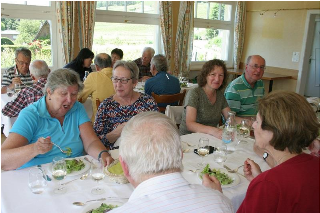
"A table" im Restaurant Bel Air