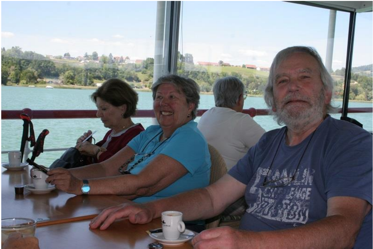
Erleichterung nach der Panne