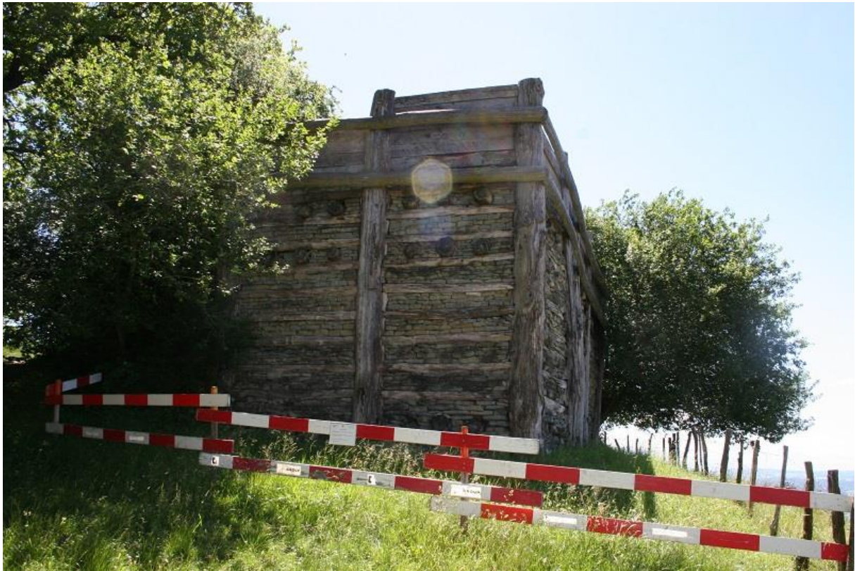
Rekonstruierte keltische Befestigung ein Sanierungsfall?