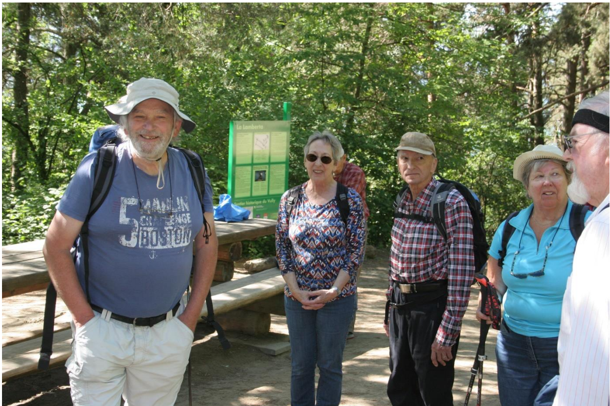
Picknick Platz bei den Grotten