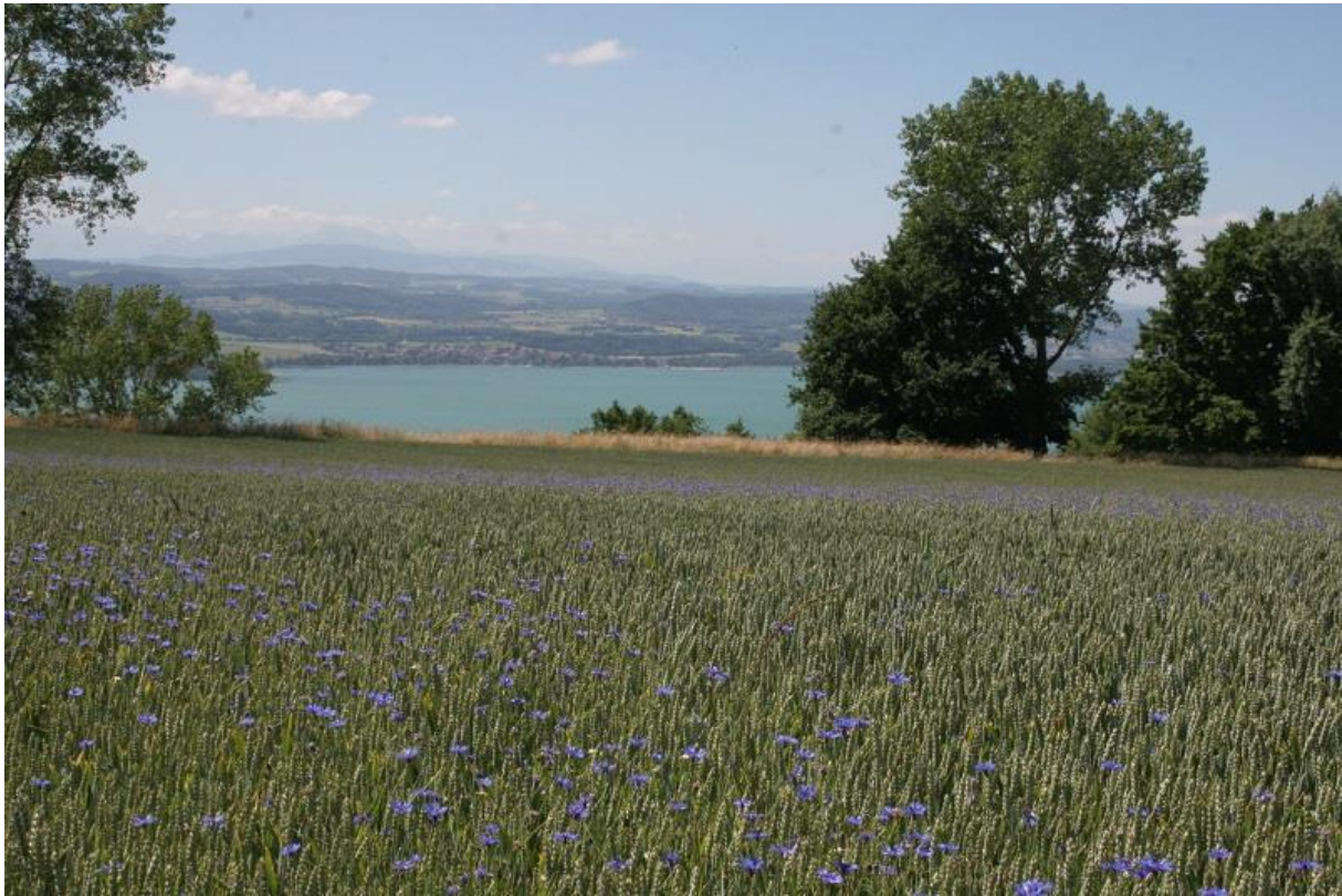
Blick vom Mont Vully auf den Murtensee