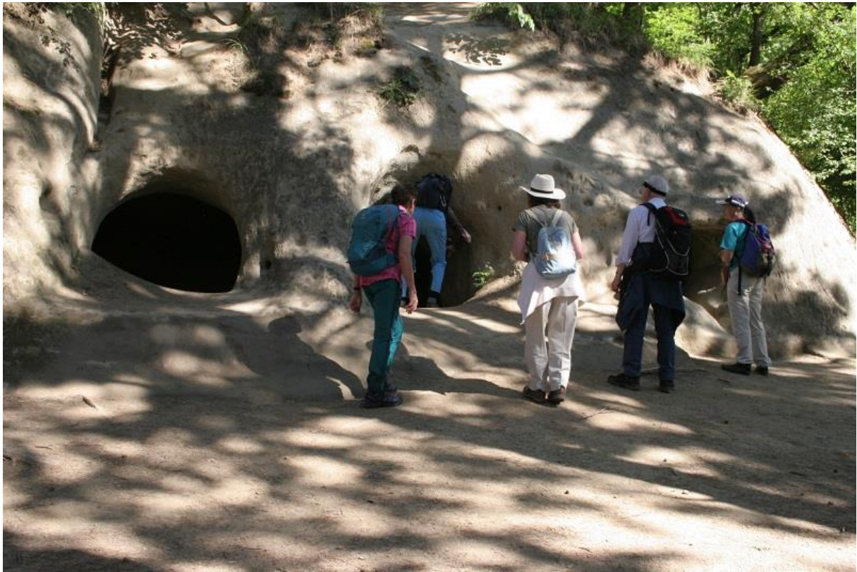
Die Grotten La Laberta