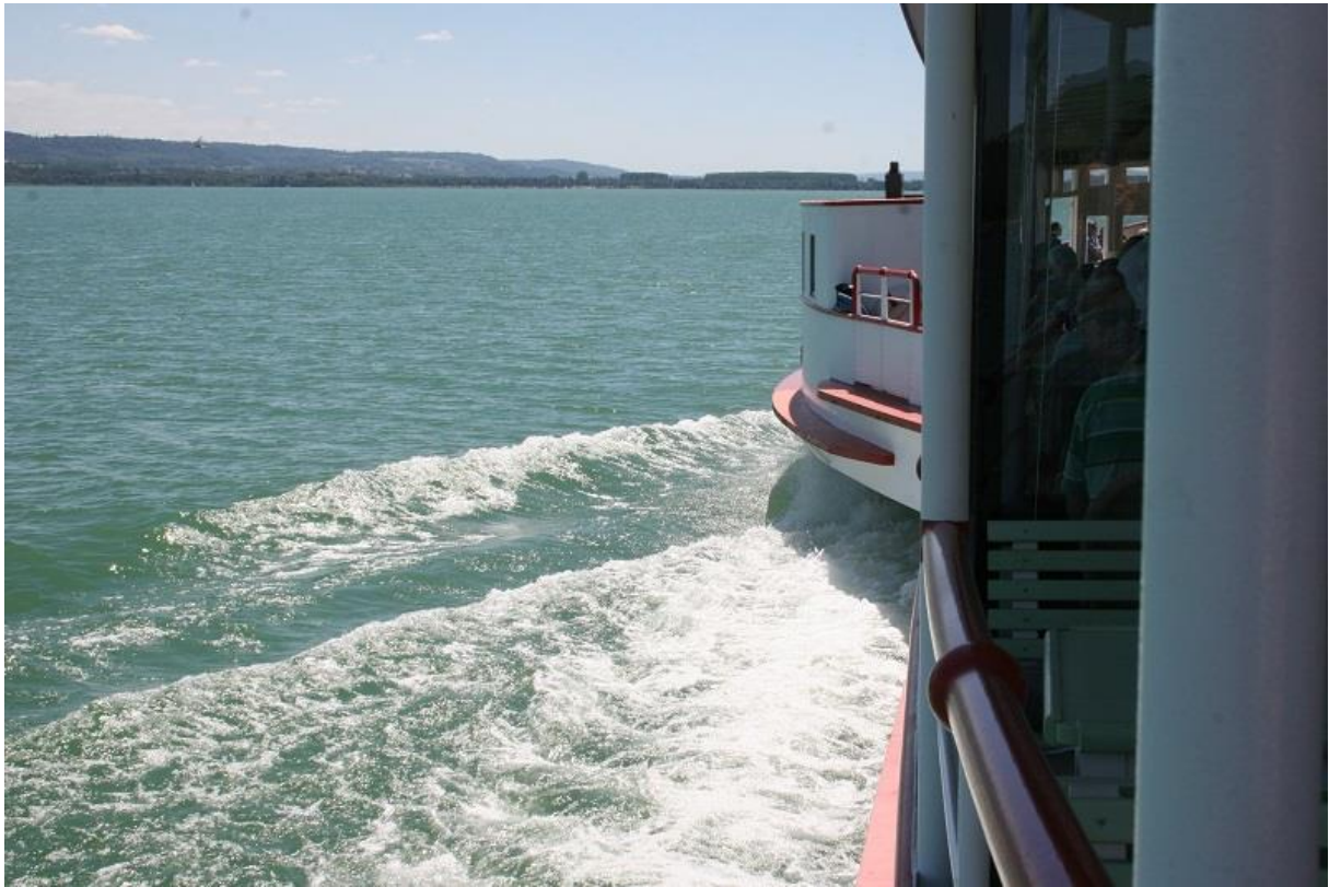
Ein echter Raddampfer ...