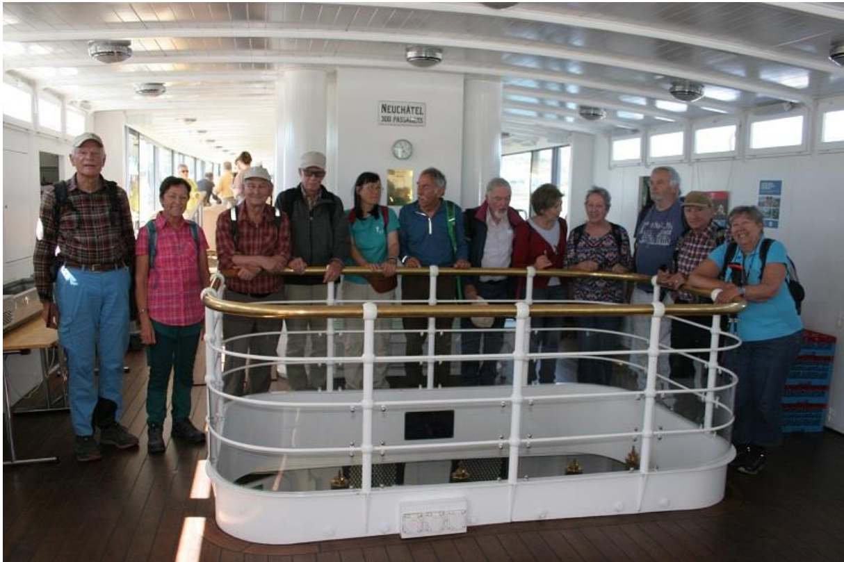
Abschied! Es war eine schöne Unternehmung.