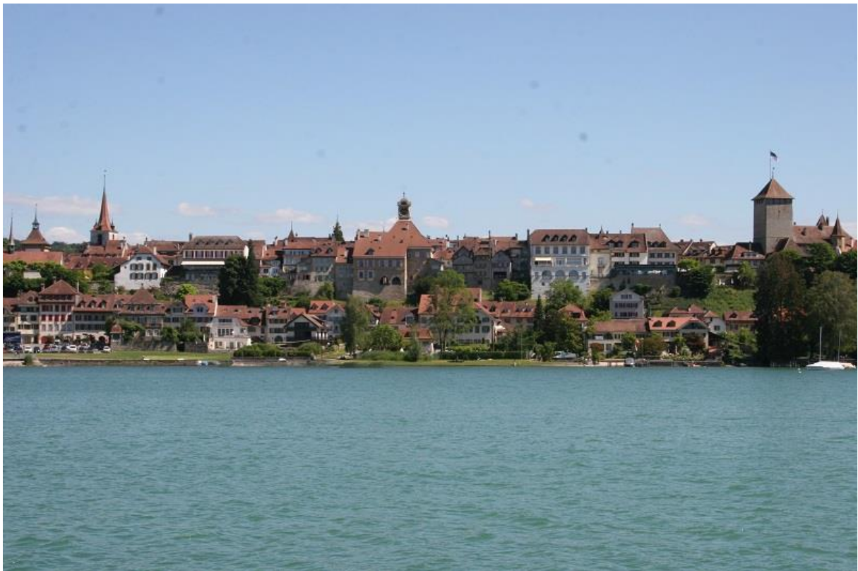
Murten nun zum Greifen nahe