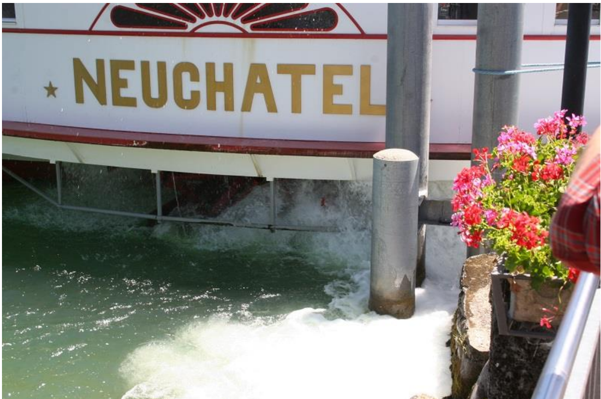
Und so heisst es.