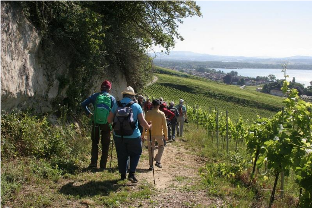
Rebberge bei Lugnorre, Blick nach Osten