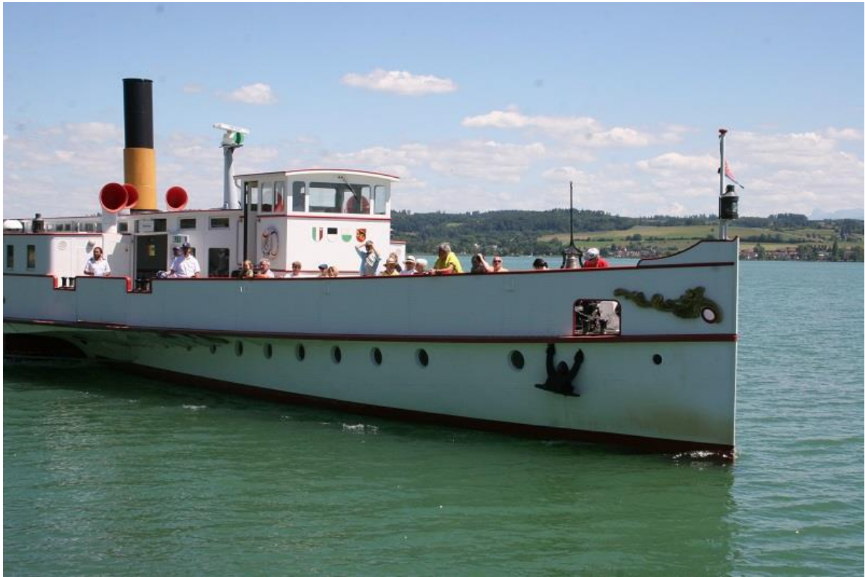
Da kommt ein Schiff