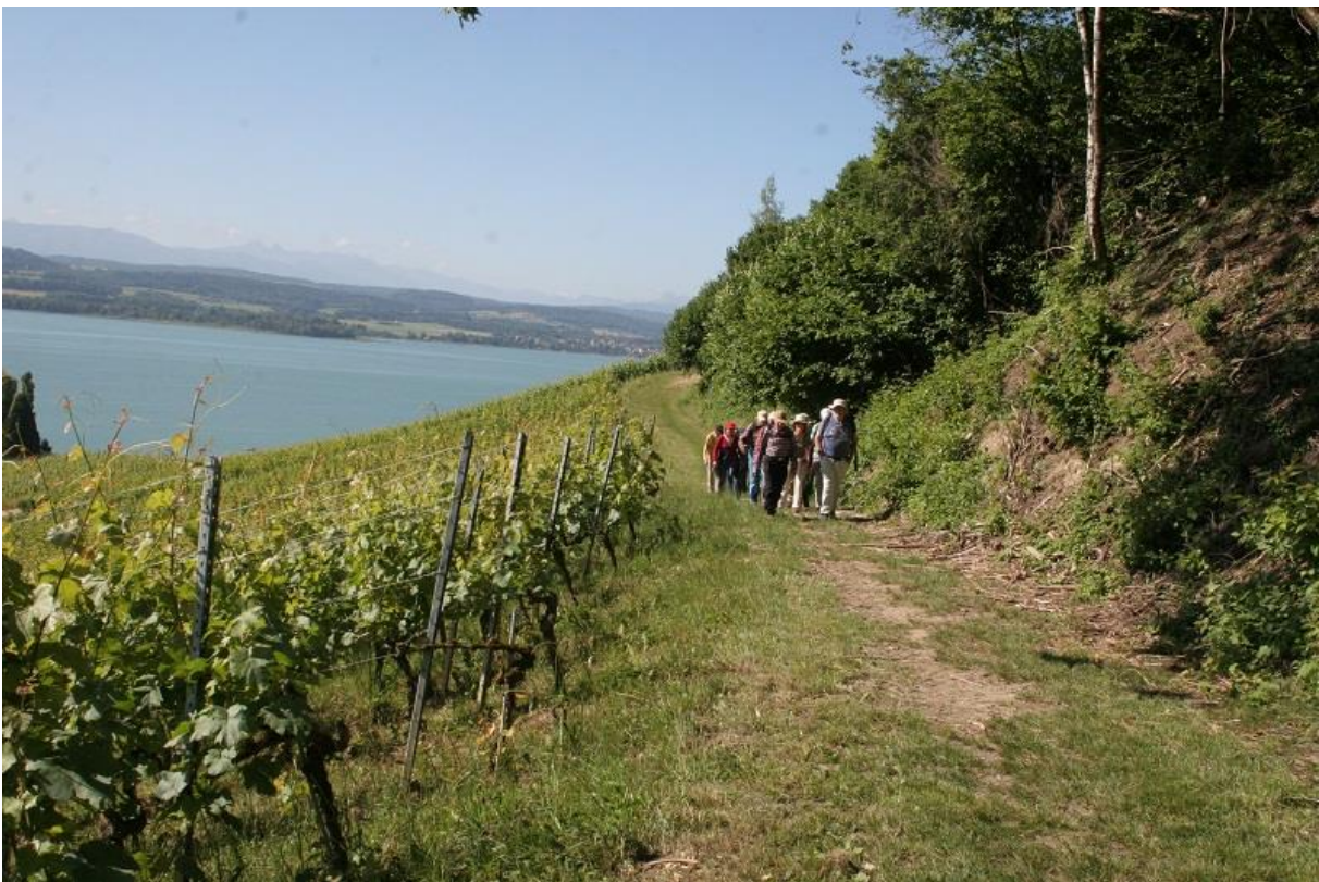
Rebberge bei Lugnorre, Blick nach Westen