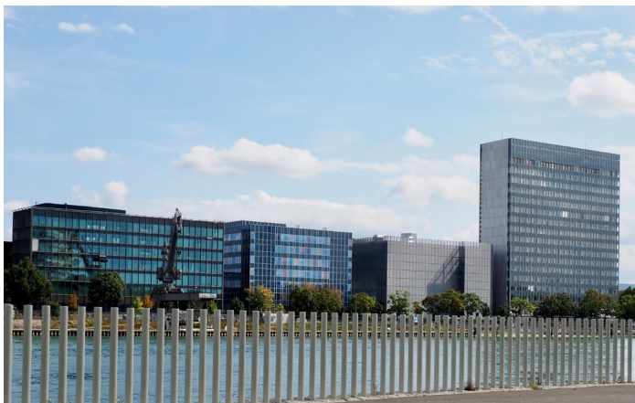
Klybeck Rheinufer, Foto:Felix Räber

Mittwoch, 28. August 2024 um 15:00 Uhr, im Klybeck, WKL-105