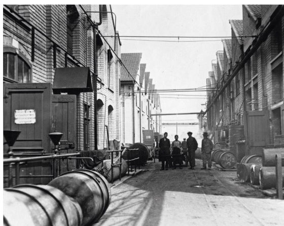
St. Johann Arealstrasse 3, Sommer 1920

Anschliessend hält Walter Dettwiler einige Überraschungen für Sie bereit. Entdecken Sie einzigartige Schätze aus dem Firmenarchiv der Novartis.