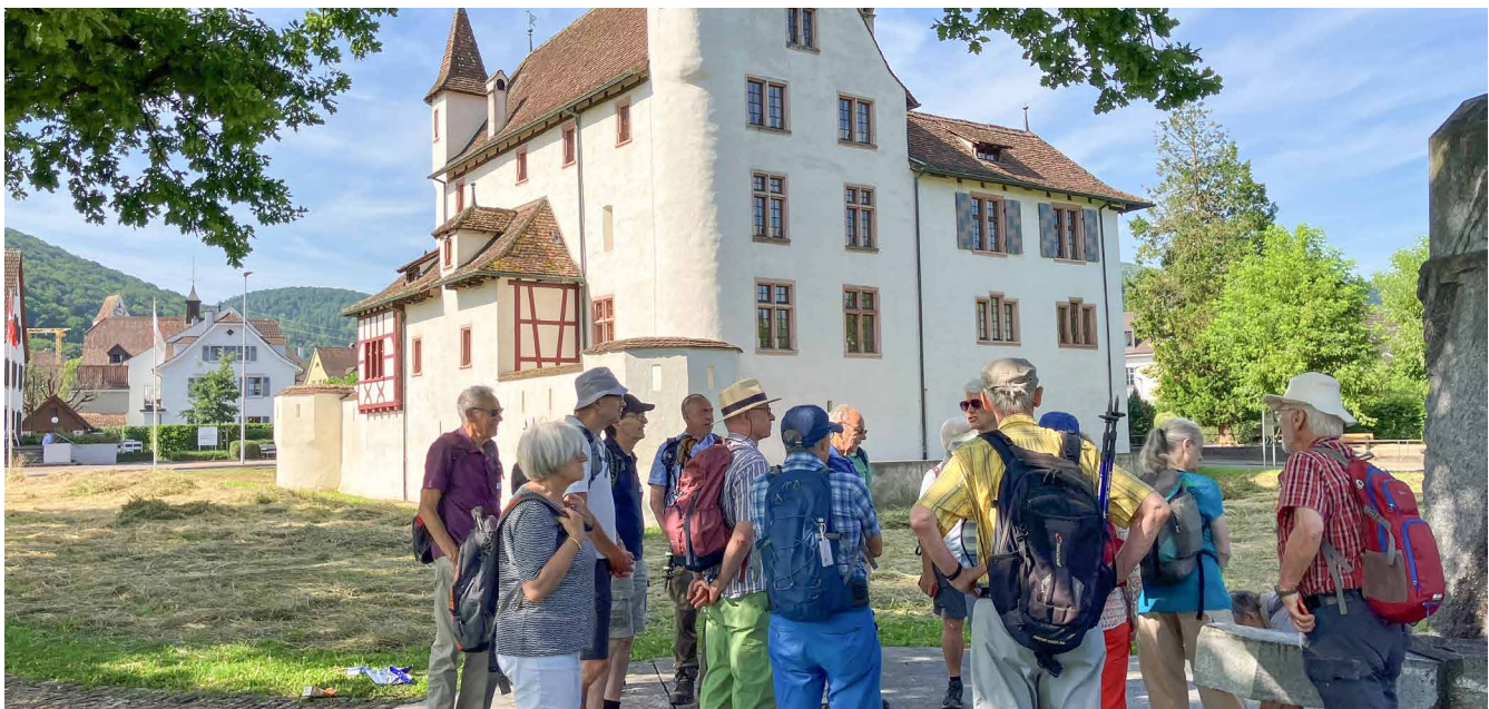
NPV-Mitglieder vor dem Wasserschloss Pratteln