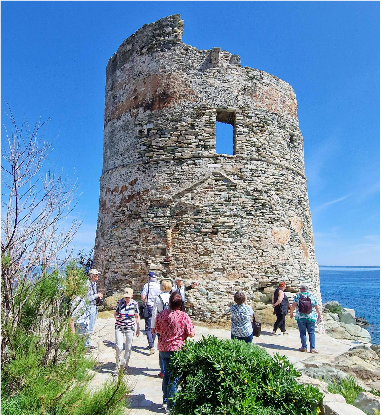
Genueserturm in Erbalunga