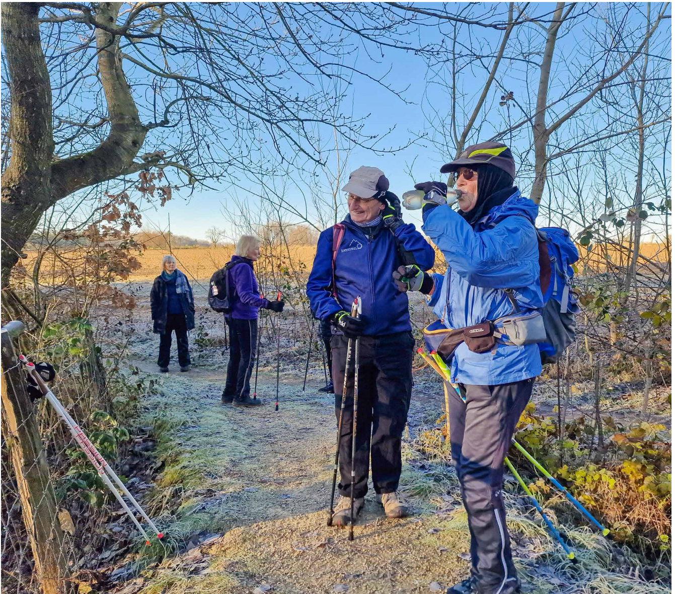
Auch bei kälterem Wetter unterwegs!