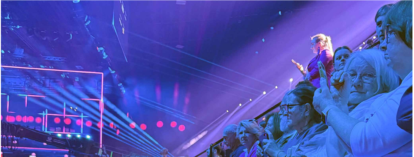
Ein unvergesslicher Nachmittag für die glücklichen Gewinner – live dabei beim ESC.

Aufgrund des Erfolgs dieser Veranstaltung hoffen wir, dass sich Pro Senectute dazu entschliessen wird, künftig auch in Basel, wie schon in Bern oder in Zürich, regelmässig solche Discos zu organisieren.