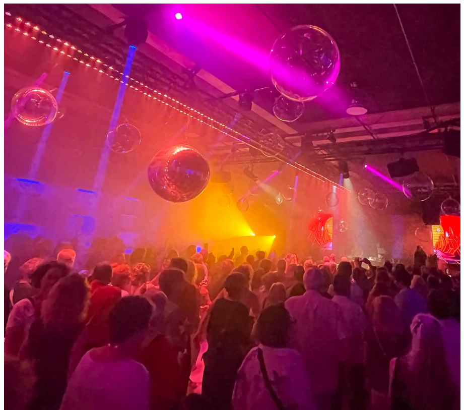
Magische Atmosphäre in der Messe-Halle.

Kaum hatte ich jedoch die Messe-Halle betreten, fand ich sie auch schon vor. Hunderte von Senioren und Seniorinnen standen da mit einem Lächeln auf den Lippen und strahlenden Augen! Viele «shaketen» zu bekannter Musik aus den 80er Jahren... andere wippten vor sich hin, während sie an einem Drink nippten. Es herrschte eine magische, etwas surreale Atmosphäre. Vergessen die kniefenden Knie, die knirschenden Hüften. Ich konnte nicht widerstehen und habe mich von der warmen Atmosphäre, den Lichtern und den DJs mitreissen lassen. Ich vergass die Zeit und die Jahre.