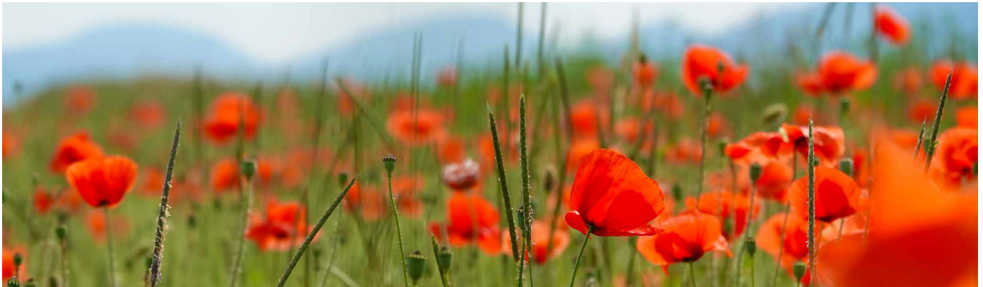
Sommerliche Grüße aus dem Baselbiet.