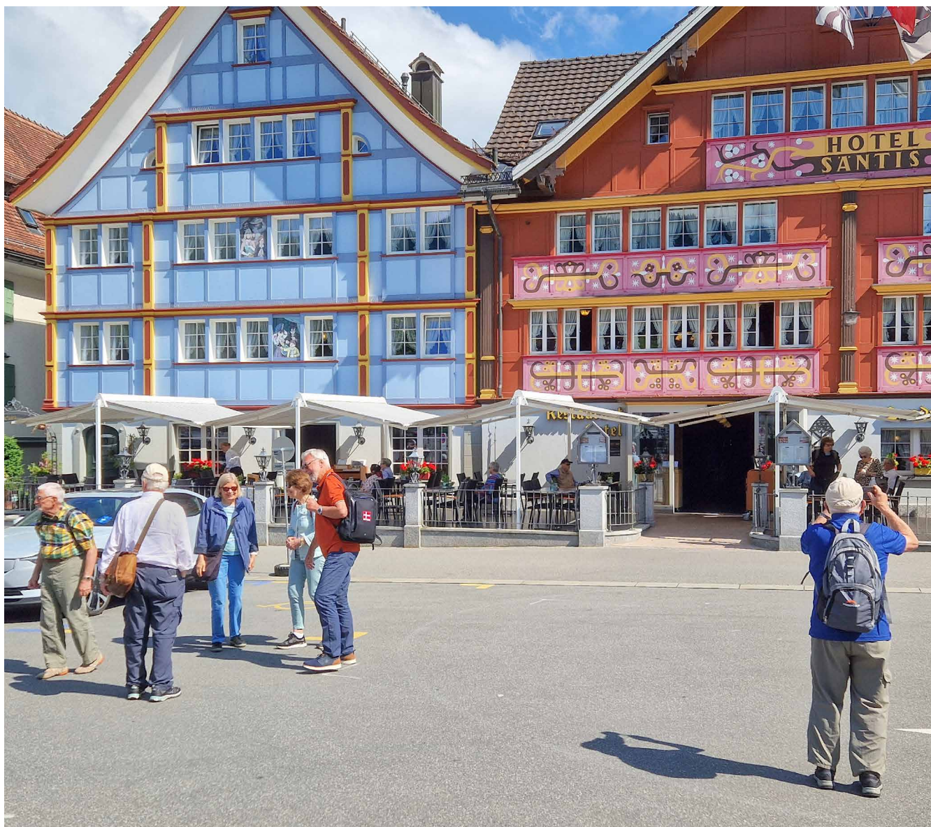
NPV-Mitglieder vor dem Romantik Hotel Appenzell, beim Landsgemeinde Platz