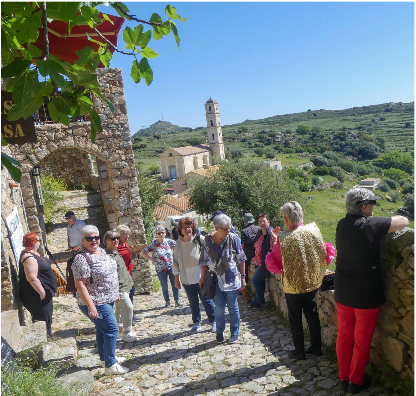
Führung in Sant'Antonino

Wir verlassen Bonifacio und fahren Richtung Nordwesten nach Ajaccio, Hauptstadt Korsikas und Geburtsstadt von Napoleon. Wir besichtigen unverzüglich das Zentrum dieser quirligen Stadt. Im typisch korsischen Restaurant «Le20123» kommen wir in den Genuss eines sehr reichhaltigen korsischen Abendessens.