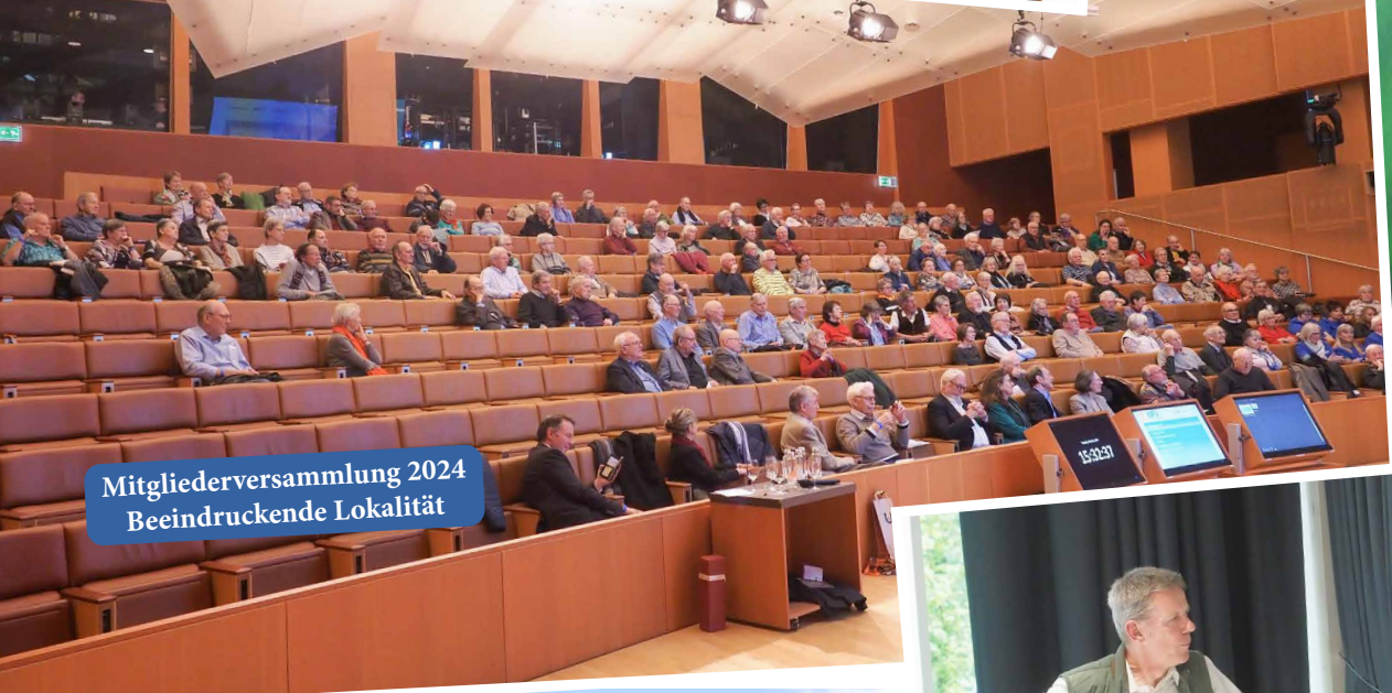
Mitgliederversammlung 2024 Beeindruckende Lokalität