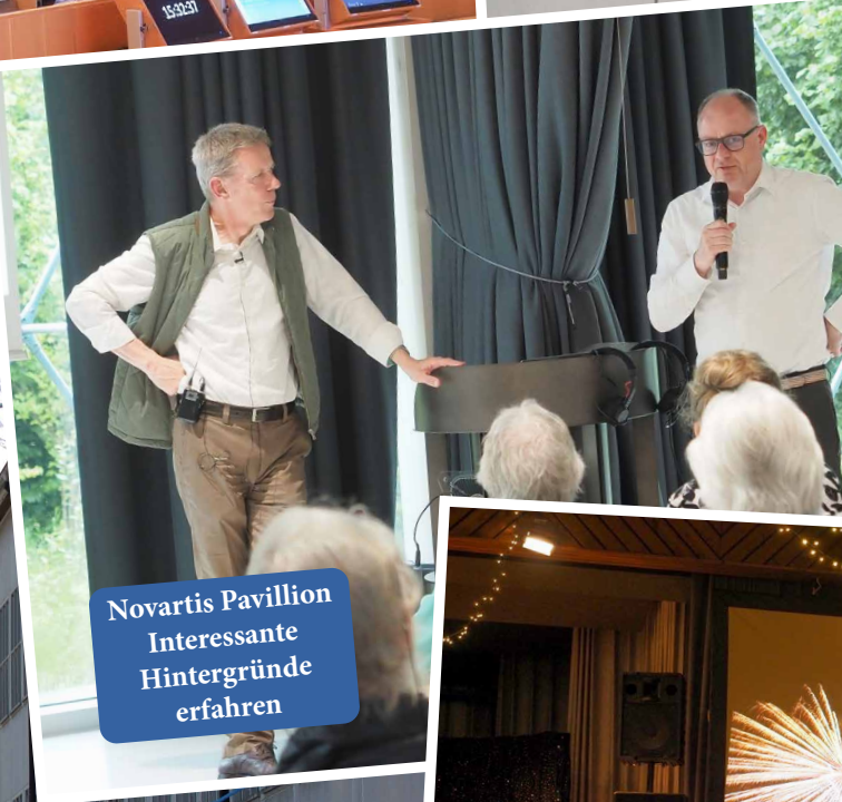
Novartis Pavillion Interessante Hintergründe erfahren