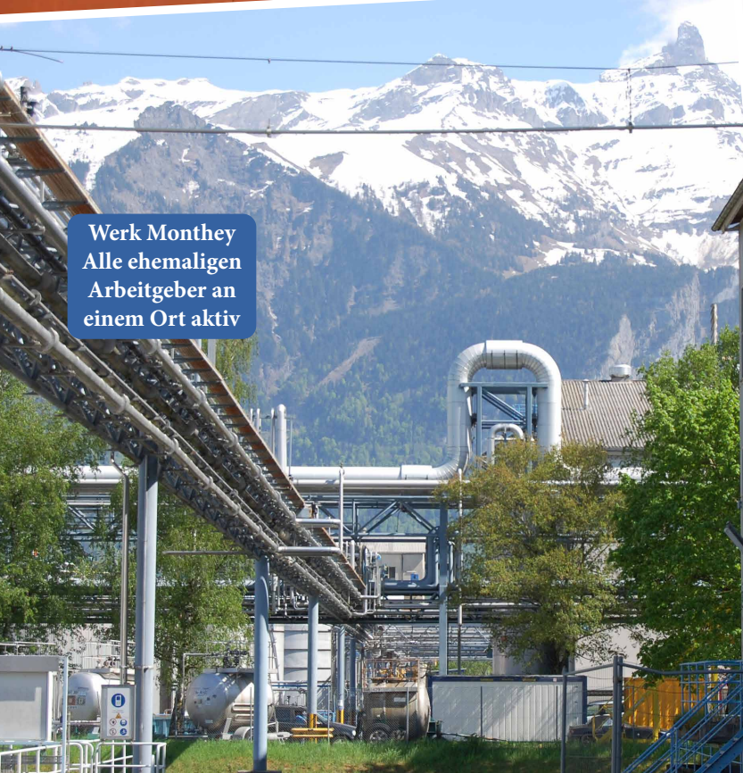
Werk Monthey Alle ehemaligen Arbeitgeber an einem Ort aktiv