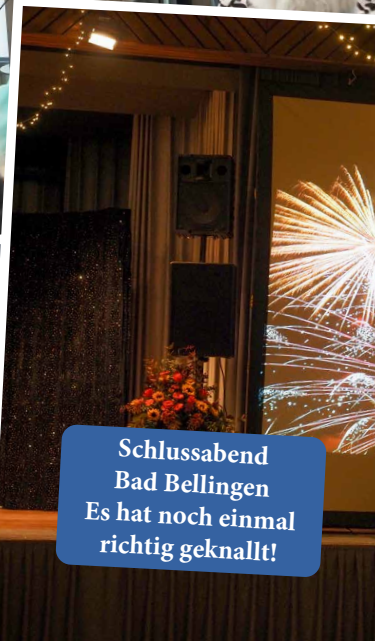
Schlussabend Bad Bellingen Es hat noch einmal richtig geknallt!