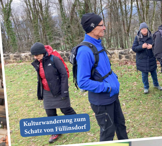
Kulturwanderung zum Schatz von Füllinsdorf