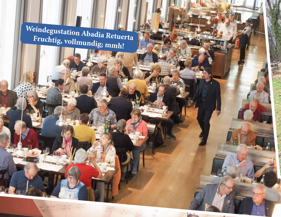
Weindegustation Abadia Retuerta Fruchtig, vollmundig; mmh!