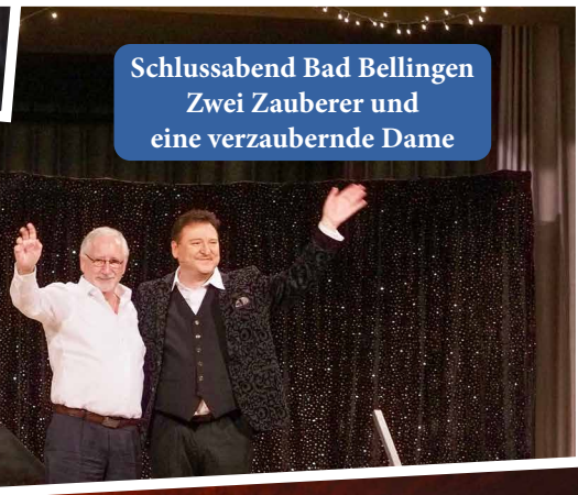
Schlussabend Bad Bellingen Zwei Zauberer und eine verzaubernde Dame