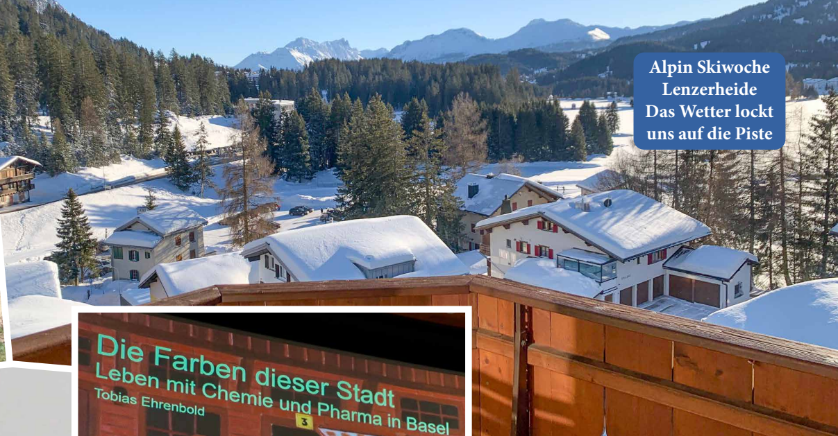
Alpin Skiwoche Lenzerheide Das Wetter lockt uns auf die Piste