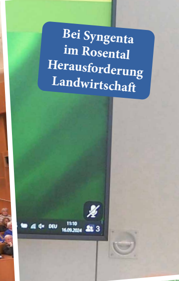
Bei Syngenta im Rosental Herausforderung Landwirtschaft